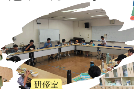
研修室 机とイスがあります