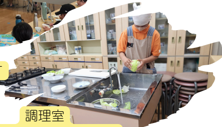
調理室 調理器具・食器類使用可