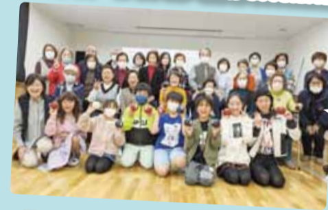
松原学区お楽しみ交流会(ポッチャ)