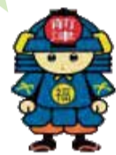
福祉会館キャラクター まえづ太郎