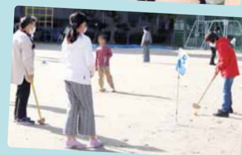
大須学区多世代交流グラウンドゴルフ大会