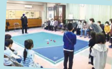
橘学区たちばなきらく会 トワイライト交流会