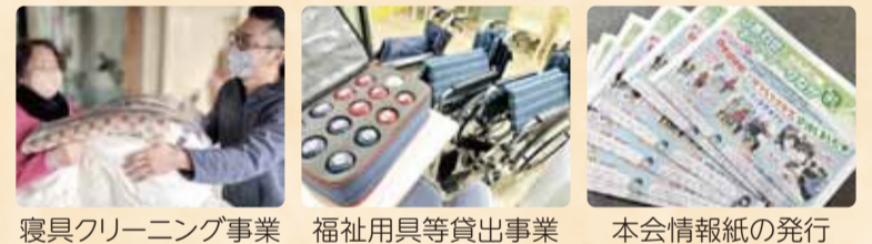
寝具クリーニング事業 福祉用具等貸出事業 本会情報紙の発行