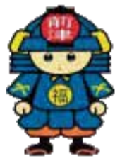
福祉会館キャラクター まえづ太郎