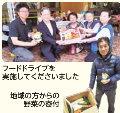
フードドライブを 実施してくださいました

今年度のテーマは「ネグレクト」でした。なぜネグレクトが起こるのか、その特徴やサイン、専門機関の支援方法などを学びました。その他、おばちゃん食堂の実践報告では、貧困は見た目ではわからないこと、外見でわからなくても子ども食堂の利用者の中には活動を頼りにしている子どもが必ずいるとお話ししてくださいました。