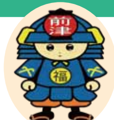
前津福祉会館キャラクター まえば太郎