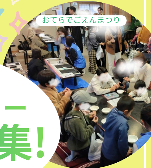
地域福祉活動計画の実施