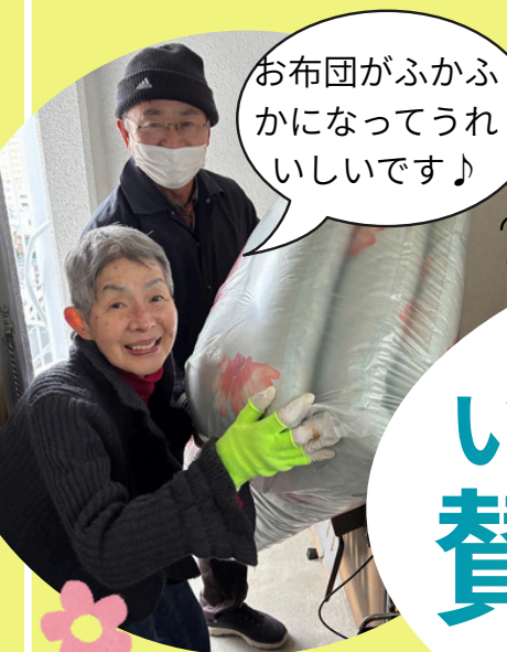
寝具クリーニングサービス事業