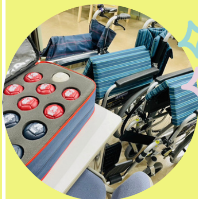
各種貸出サービスの実施

中区社会福祉協議会では、福祉のまちづくりをすすめるための取組みを応援いただける「いちよぴサポーター（賛助会員）」を募集しています！皆さまのご協力をお願いいたします。