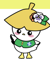
中区社協 マスコットキャラクター いちよぴ