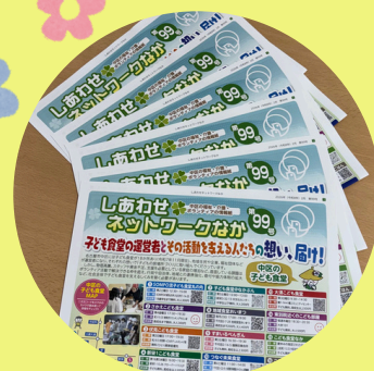
本会情報紙の発行

中区社会福祉協議会では、福祉のまちづくりをすすめるための取組みを応援いただける「いちよぴサポーター（賛助会員）」を募集しています！皆さまのご協力をお願いいたします。