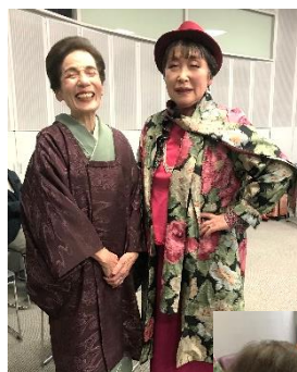
シニアファッション ショー参加

社会福祉法人 名古屋市中区社会福祉協議会 中区上前津二丁目12番23号 中区在宅サービスセンター内